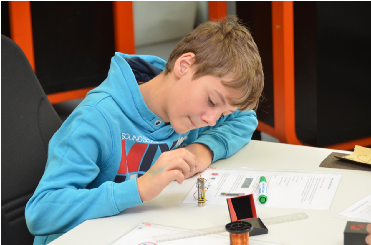
Impressionen vom Tag der Technik 2019: Ein Schüler experimentiert mit einem Magnetfeld.

Durch Mitmachen Begeisterung für Technik wecken - dieses Konzept hat sich bewährt: Zum Tag der Technik 2019 kamen rund 1.200 Interessierte in das ILW Mainz. Fast 40 Betriebe boten ihnen Gelegenheit, selbst aktiv zu werden: zum Beispiel einen Metallroboter zu bauen, ein LED Herz zu löten, ein Verlängerungskabel herzustellen, einen Kabelverteilerschrank zu verdrahten, oder einen 3-D-Druck auszuführen. Ein weiterer Pluspunkt des Tags der Technik liegt darin, dass die Betriebe in erster Linie durch ihre Auszubildenden vertreten sind, die Schülerinnen und Schüler also Gesprächspartner haben, die vor nicht allzu langer Zeit vor ähnlichen Fragen und (Berufs-) Entscheidungen standen wie sie selbst.